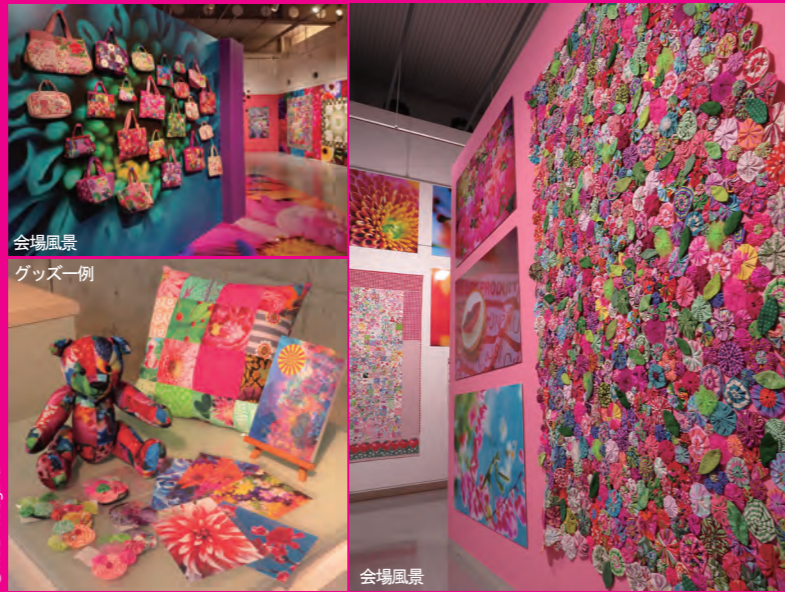
会場風景 グッズ一例