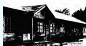
▲宿泊施設時代の写真

設立70周年を契機に、これまでのあゆみと業績に感謝の意を表す「設立70周年記念ロゴマーク」を職員の中から募集し、作成しました。今年は、このロゴマークに込めた思いをさまざまな機会を通して伝えるとともに、80周年に向けて、これからも愛し愛されるあわら市金津雲雀ヶ丘寮であり続けるようサービス提供に取り組んでいきます。