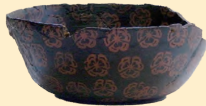
▲漆塗椀(市指定文化財 工芸)

とき 4月20日(土)～5月19日(日) ところ 郷土歴史資料館 特別展示室 入場料 無料