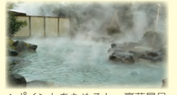
▲ポイントをためると、豪華景品(あわら温泉ペア宿泊券)が当たるかも?

さらに、応募用紙を提出した人の中から抽選で、豪華景品(あわら温泉ペア宿泊券)が5人に当たります!