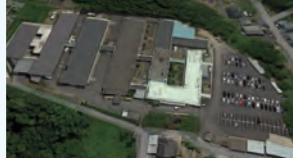
▲現在の施設全景航空写真