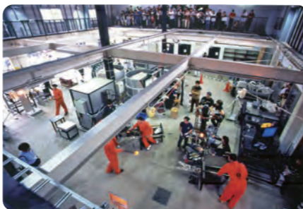
▲イベント「ガラスアートドキュメント'98」 公開制作風景・1998年