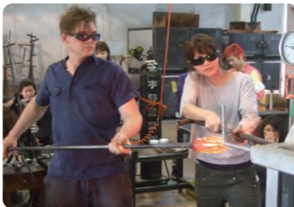
▲春季ガラスワークショップ授業の風景・2011年