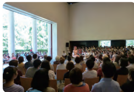
▲参考画像「蛭川実花展」アーティストトーク・2013年

日時 3月16日（土）～24日（日）※18日（月）休館 〈関連イベント〉 10:00～17:00（最終日16:30） ほのぼの市 ※最終入場は終了時間の30分前 16日（土）・24日（日） 会場 アートコア ミュージアムー1、ギャラリー 11:00～15:00 観覧 無料