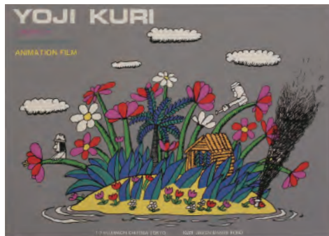
アニメーションフィルム「2匹のサンマ」(ポスター) クリヨウジ

全国から約80人の作家が、陶磁器・ガラス・木工・皮革などさまざまな素材で生活を豊かにするクラフト作品を販売。実演やワークショップを通してものづくりの良さを体感できます。森のキッチンでは、福井を代表するパティスリーの店「ガトーケイイチ」など、昨年に引き続きスイーツで森を彩ります。