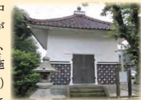
▲福圓寺の輪転経蔵外観（市指定文化財・建造物）

下番の福圓寺にある輪転経蔵は、内部に八角形の輪蔵をもちます。山門を入った左手（南側）にあり、縦約5.3メートル、横約5.3メートル、高さは約7.7メートルある方形の木造平屋建てで、宝形屋根の頂部に宝珠を乗せています。瓦は越前赤瓦を使用した棧瓦葺で、軒裏や外側上部は白漆喰で塗籠め、下部は海鼠壁としています。組物などではなく、簡素な外観ですが、赤瓦や白漆喰壁、褐色の海鼠壁など、外観の色合いが調和し、とても清楚で美しいです。