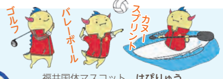
福井国体マスコット はびりゅう