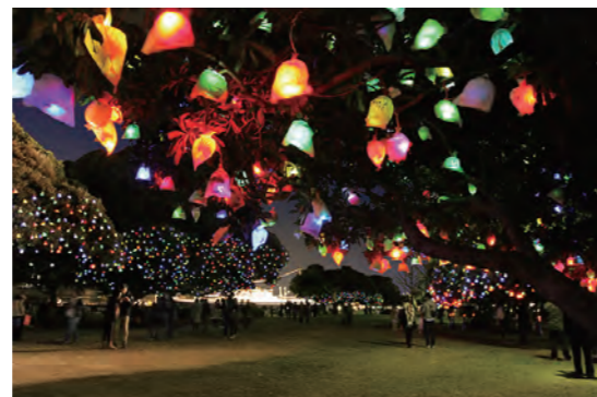
<参考作品> ひかりの実 HOPE 三陸・横浜ひかりの実交換プロジェクト (山下公園・横浜) WORK SHOP 横浜市内 2011年

日時: 11月27日(日) 16:00~17:00 会場: アートコアミュージアム-1、ギャラリー ※要展覧会観覧券