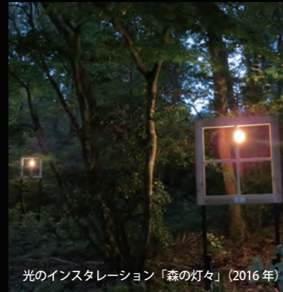
光のインスタレーション「森の灯々」(2016年)

12月11日(日)まで開催中 10:00~17:00 (最終入場 16:30) ※月曜休館 会期中の日曜日は 20:00 まで開館延長 (最終入場 19:30)