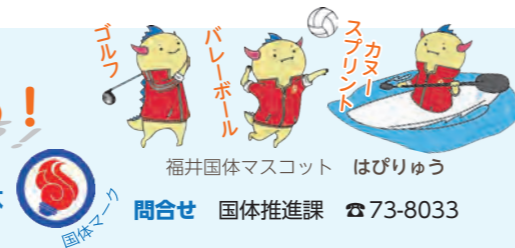
福井国体マスコット はぴりゅう