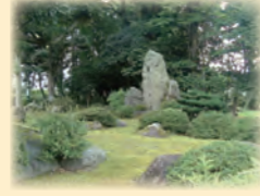
市指定文化財(名勝) 龍澤寺庭園(枯山水)