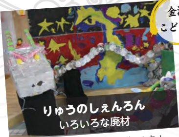
園児たちも参加!力作です!