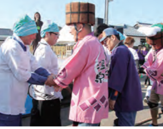
▲互いの健闘をたたえ合う。