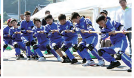
▲男女とも強い芦原中チーム。