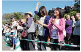
▲当日は約1500人が来場。応援にも力が入ります。