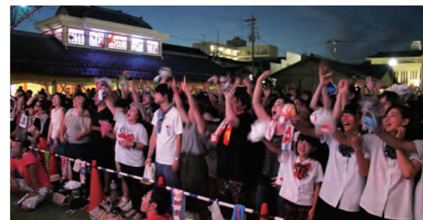
▼SEAMOの無料ライブで広場が満員に