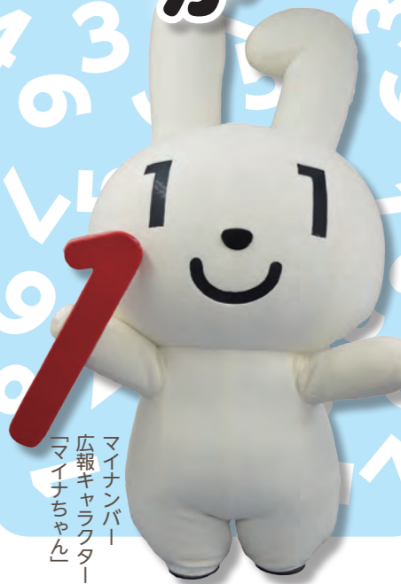
マイナンバー 広報キャラクター 「マイナちゃん」