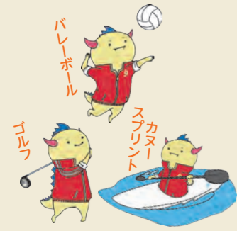
福井国体マスコットはぴりゅう

過日、西川知事から県内の全首長に開催決定書が手渡されました。あわら市はバレーボール、ゴルフ、そしてカヌースプリントの3競技。市役所庁舎はあの東レの元工場ですから、ご存じのようにバレーボールのメッカだったわけです。県内でもっとも多くのゴルフ場を有するあわら市はゴルフ競技にうってつけ。カヌーポロが盛んな北湯湖では、スピードを競うスプリントに励む若者が増え、湖面を