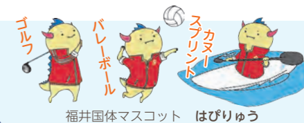
福井国体マスコット はびりゅう