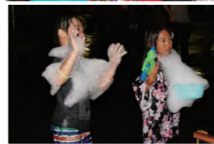
子どもたちもお湯と泡まみれ