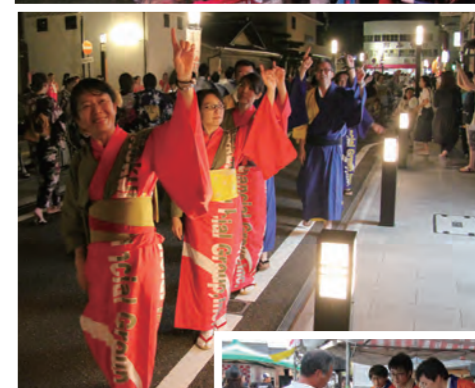
湯〜わくDoriで優雅に踊る「民謡の夕べ」