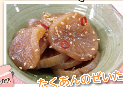
伝統の味 たくあんのぜいたく煮