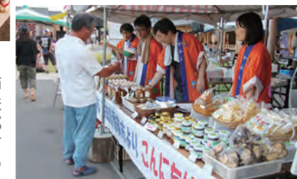
姉妹都市高知市よる産品販売の特美の

「父親子育て応援団おっとふぁーざー」による家族イベントが行われました。お父さんの子育て参加を応援することを目的に活動するあわら市や坂井市などの男性保育士5人が絵本ライブやパネルシアター、ふれあい遊びなどを行いました。