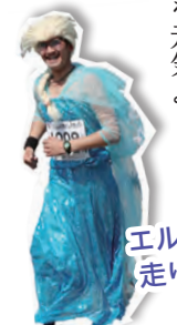
エルサも10km走りました!

5月17日に第12回あわら市トリムマラソンを開催。2308人のランナーたちが、新緑薫る市内を元気に走り抜けました。 問合せ スポーツ課 ☎73-80043