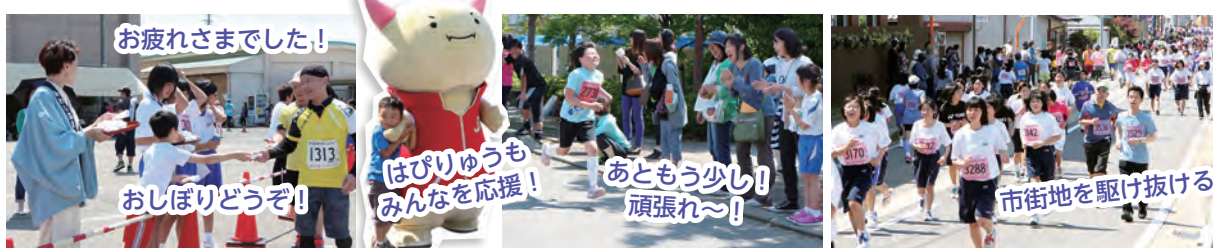
お疲れさまでした!