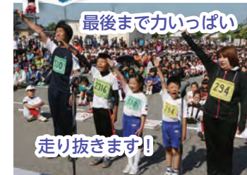
最後まで力いっぱい