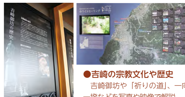
●吉崎の宗教文化や歴史 吉崎御坊や「祈りの道」、一向一揆などを写真や映像で解説。