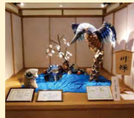
平成26年度本陣飾り物コンクール市長賞 六日区 川蝉