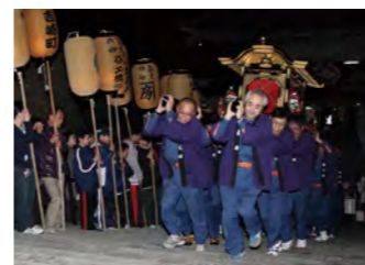
▲4月23日からの蓮如忌には毎年多くの門徒が訪れる。

かつて蓮如が浄土真宗を北陸に広める足がかりとした吉崎御坊があった吉崎地区は、宗教文化の発信地であり、多くの門徒が訪れ、にぎわいを見せていました。その「蓮如の里」吉崎を含め、越前加賀地域に点在する豊かな宗教文化資源をつなぎ、観光周遊ルート「越前加賀宗教文化街道（祈りの道）」をあわら市、坂井市、勝山市、永平寺町、加賀市