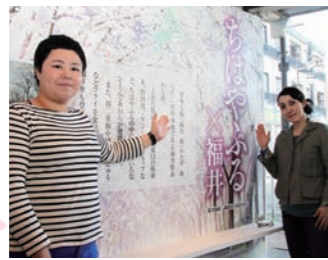
▲アンテナショップのスタッフ

当たり前に見てきた景色がこんなに穏やかです。漫画を通して、改めてあわら市の魅力に気付きました。市外の人はもちろん、市内の人でもあわらの魅力を再発見できるイベントになってほしいですね。