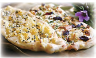
▲ 温泉ピッツア (あわら)

参加者全員にオリジナル参加賞があるほか、山頂での刈安そば無料サービスやクイズラリー、お楽しみ抽選会もあります。