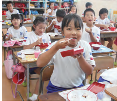
ソースカツ弁当、切り干し大根と打ち豆の煮物（伝承料理）、スイカ（あわら産）など