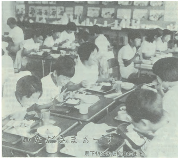
◀旧芦原町の小中学校では、県内で初めての米飯給食が1971（昭和46）年にスタート