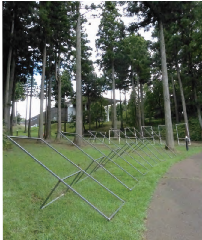
▲立地(熊)I. II / 鉄. 2012年 水辺の広場

アートドキュメントシリーズ第15弾は、福井県若狭町在住の長谷光城氏を招待。パルプや楮を固めて作り出した「内部連結」シリーズをはじめ、石・木・鉄など多彩な素材で表現を追求している現代美術家です。昨年、「界」シリーズ「平面であって平面でない平面」を発表し作品制作に対する試みはとどまる所を知りません。 本展は、「はざま」をテーマに「平面と立体」や「平面と表面」など2つの事物の関係に必ず存在する「はざま」を見つめながら、さまざまな広がりを見せる長谷作品の変遷をたどるとともに、本展のための新作や野外作品をご紹介します。