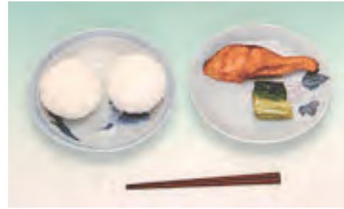
▲明治22年の献立は、おにぎり、焼き魚、漬け物など