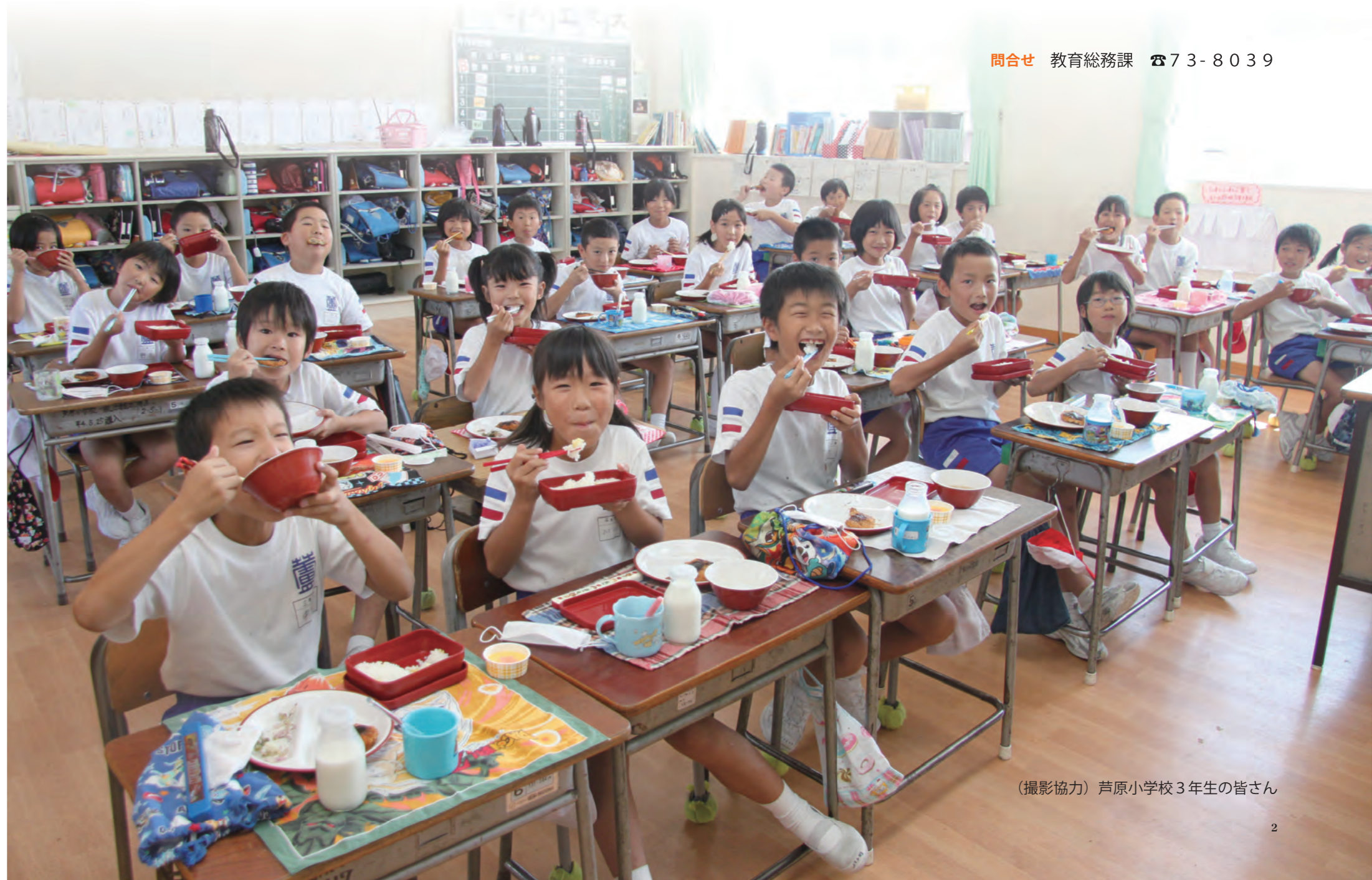
（撮影協力）芦原小学校3年生の皆さん