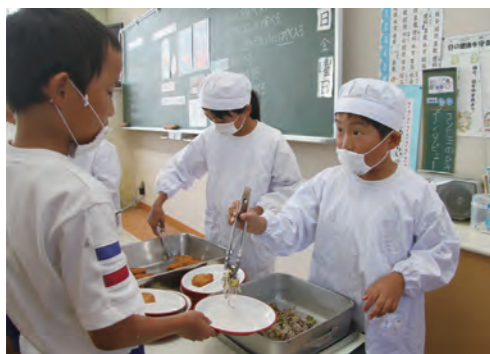
▲ 配膳のときも、白衣やマスクで衛生的に

温かい物は温かく、冷たい物は冷たく、適温で提供できるように、保温性の高い食缶を使用し、子どもたちがおいしく安全に食べられる工夫をします。