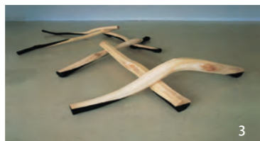
1. 内部・連結 82-52 / 楮・パルプ 1982年 2. 界・表相 II / キャンバス・油彩 2011年 3. CAN-WOOD No.6 / ケヤキ・樹脂絵具 1997年