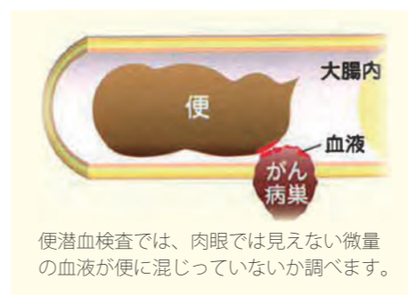
便潜血検査では、肉眼では見えない微量の血液が便に混じっていないか調べます。

福井県の大腸がんによる死亡数は、がん全体の中で第3位、女性だけでみると第1位となっています。大腸がんは、初期段階では自覚症状がほとんどありません。大腸がんのリスクは40歳代から高まります。40歳になったら、定期的に検診を受けることが大切です。 受診方法は、各公民館や保健センターの集団検診会場で容器を受け取り自宅で採便する方法（ 集団検診 ）と、県内の指定医療機関で容器を受け取り自宅で採便する方法（ 個別検診 ）があります。 集団検診（20歳以上） 申し込みは不要です。集団検診日に会場にお越しください。検査料金は、69歳以下500円、70歳以上2000円です。 検診の日程・会場は、裏表紙の「くらしのカレンダー」をご覧ください。 個別検診（40歳以上） 受診券が必要です。事前に健康長寿課へお申し込みください。検査料金は一律500円です。指定医療機関で支払ってください。 無料クーポン券 特定の対象者には、大腸がん検診が無料で受けられるクーポン券を5月上旬に個別送付しています。ぜひ、ご活用ください。対象者は、40歳、45歳、50歳、55歳、60歳（平成24年4月1日現在）の人です。 問合せ 健康長寿課 健康増進G ☎73・8023