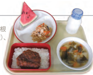
▲ 子どもたちに1番人気の通称「カツ弁」