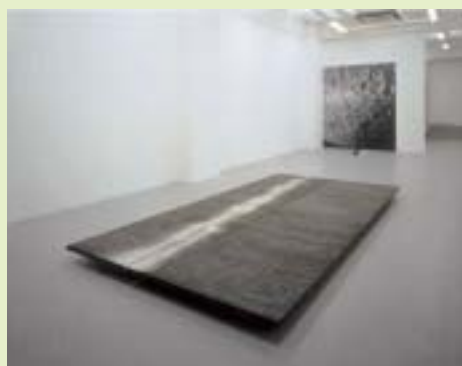
村岡三郎「The Crust」