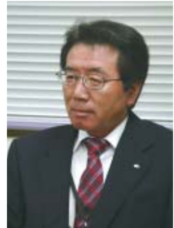
財政部長 田中 利幸