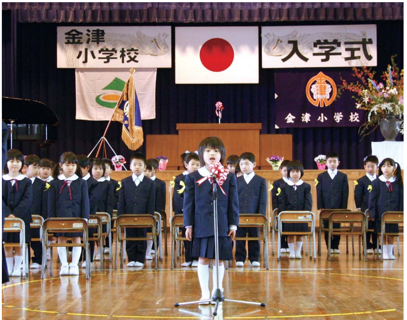
入学式 4月7日 金津小学校