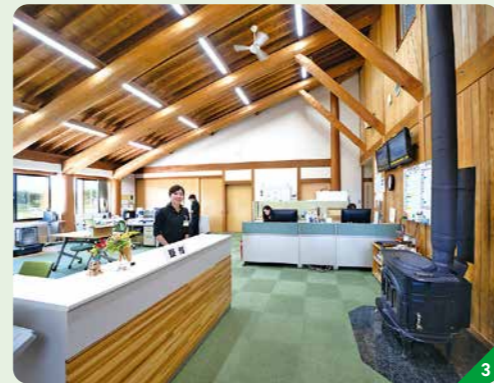
① 高性能機械の導入で、職員が安全に仕事を行える環境も整備 ② 高木伐採など特殊技術が職人に受け継がれている ③ 木をふんだんに使った組合事務所。森林施業プランナーが所有山林の相談にのっている