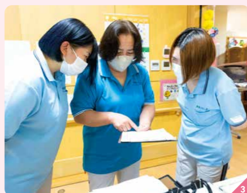
1 スタッフポロシャツは好きな色を選べる 2 浴衣姿のスタッフと一緒に緑日やゲームを楽しめる「夏祭り」など季節の行事を開催 3 利用者に最適なケアのため、職員同士が常に声を掛け合いコミュニケーションを重ねている