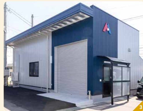
1 電子部品を熱で傷めることがないよう、素早くはんだ付けを進めていく 2 さまざまな電子部品が載ったプリント基板。一つ一つが全て手作業によるもの 3 多種多様の依頼に柔軟に対応できるよう、社屋を増築し万全の体制を整えている