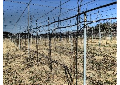
早期成園化が図れる ジョイント栽培