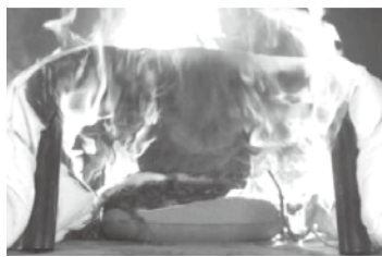
★こたつ布団や座いす、座布団がこたつ内のヒーターユニットに触れないように注意！