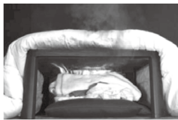
★こたつの中で衣類を乾かさない！