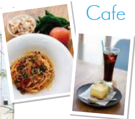
◀本格パスタとコーヒーが味わえるカフェ